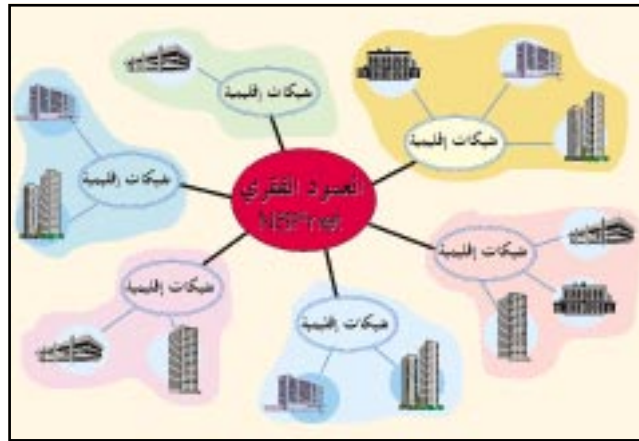
● شكل (١) البنية التحتية للإنترنت - في الماضي .

(Federal Internet Exchange) أنشئت خصيصاً لربط الشبكة العسكرية (MILnet)، وشبكات ناسا، والشبكات التابعة للحكومة الفدرالية، وتقع هذه النقاط في شرق وغرب سواحل الولايات المتحدة الأمريكية، حيث تقع نقطة الربط الحكومية الشرقية في جامعة ميريلند، بينما تقع نقطة الربط الحكومية الغربية في مركز بحوث ناسا بكاليفورنيا. ومن جهة أخرى فإن عدد من مشغلي الأعمدة الفقرية التجارية انضموا لتأسيس نقطة ربط شبكي حكومي (Commercial Internet Exchange) للجهات التجارية على الساحل الغربي للولايات المتحدة الأمريكية. وفي عام ١٩٩٥م - وكإجراء غير من الهندسة المعمارية للإنترنت كلياً - تم إغلاق العمود الفقري لشبكة هيئة العلوم الوطنية واستبداله بعدد من الأعمدة الفقرية الوطنية المملوكة والمشغلة من قبل الجهات التجارية. وحتى يتم ترابط هذه الأعمدة الفقرية لنقل وتبادل البيانات فيما بينها فقد تم إنشاء وتمويل أربع نقاط ربط شبكي من قبل هيئة العلوم الوطنية. وكننتيجة طبيعية لهذا التغيير فقد طور مشغلو الأعمدة الفقرية أعمدهم الفقرية الوطنية لربط الشبكات الإقليمية، ومن ثم إستعمال نقاط الربط الشبكي للارتباط بمشغلي الأعمدة الفقرية للآخرين. وبسبب النمو المطرد للإنترنت، فقد ظهرت عدة نقاط ربط شبكي على المستوى