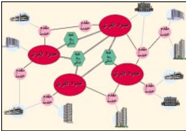
● شكل (٢) البنية التحتية للإنترنت - في الحاضر .

يتضح مما سبق أن اكتشاف وظهور وتطور الإنترنت كان بسبب تضافر جهات بحثية عديدة - جامعات ومراكز بحوث وعلماء - وليس من السهل إرجاع كل ذلك العمل إلى فرد واحد. غير أن كثيراً من المختصين يفضلون أن يعزوا اكتشاف الإنترنت في بداياته إلى كل من فنت سرف و بوب خان الذين وضعوا ما يسمى بنظام الإنترنت أو (Internet Protocol-IP) الذي يَمَكِّن الحُرْمَ من الانتقال من حاسوب إلى آخر حتى تصل إلى المكان الذي وجهت نحوه. غير أن العالم يقر بالفضل لأحد - بعد الله سبحانه وتعالى - لاكتشاف شبكة النسيج العالمية المعروفة بالويب (www = World Wide Web) إلى المهندس الحاسوبي البريطاني تيم بيرنرز (Rim Bemers-lee) الذي كان يعمل في المختبر الأوربي لفيزياء الجسيمات بجنيف، حيث باشر في أكتوبر ١٩٩٠م تصميم البرنامج وأنهاه في ديسمبر من نفس العام، وأصبح النسيج على الإنترنت منذ صيف عام ١٩٩١م. وتتيح الشبكة النسيجية (Web) إمكانية تجهيز المعلومات بطريقة يتم فيها ترابط